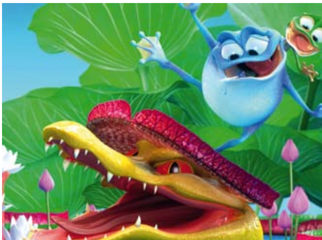
Amazonia, présenté dans la catégorie « éco bambins »

Durant tout le festival, des activités leur sont aussi proposées, notamment le programme « éco bambins », qui se compose de courts métrages à