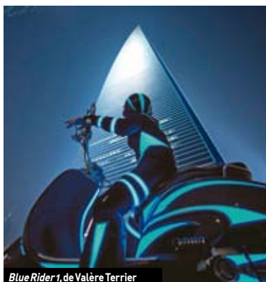
Blue Rider 1, de Valère Terrier

• Jusqu'au 24/03 | du mardi au samedi, de 14 h à 18 h | Théâtre de l'Agora Scène nationale d'Évry et de l'Essonne | Place de l'Agora 91000 Évry | Tél. 01 60 91 65 65 | www.theatreagora.com | Entrée libre