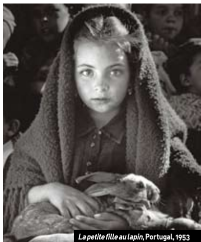
La petite fille au lapin , Portugal, 1953

• Jusqu'au 06/05, mercredi et vendredi, de 12 h à 19 h, samedi de 10 h à 12 h, et de 14 h à 19 h, et dimanche de 14 h à 19 h | Maison de la photographie Robert-Doisneau | 1 rue de la Division-du-Général-Leclerc 94250 Gentilly | Tél. 01 55 01 04 86 | www.maisondelaphotographie-robertdoisneau.fr | Tarifs: de 1 à 2€; gratuit pour les - 18 ans