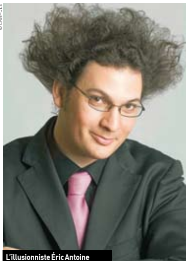
L'illusionniste Éric Antoine