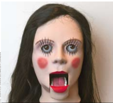
Marnie Weber, The truthspeakers girl with eggplant dress and burgundy trim , détail 2009

collection de photos dénichées par les mêmes artistes (Galerie Sud) ; et Spiritisme , tournages et performances du cinéaste canadien Guy Maddin (Forum).