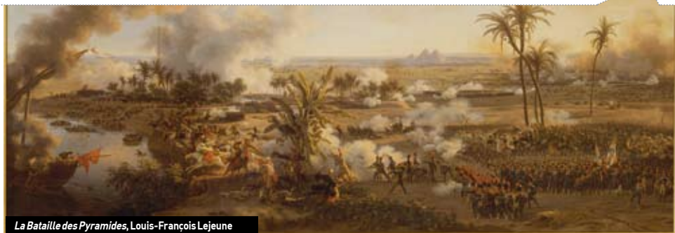
La Bataille des Pyramides, Louis-François Lejeune